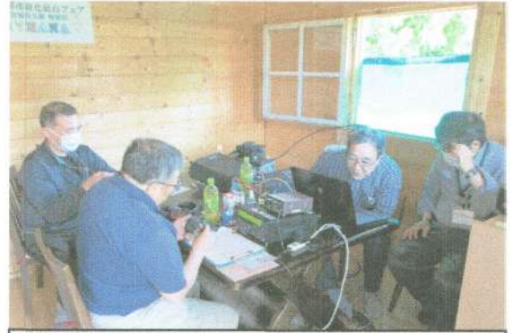
8N7HANA特別局公開運用 仙台市若林区「せんだい農業園芸センター」