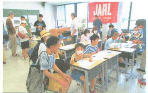
体験運用の説明を受ける体験者

7月16日(日)東北大学川内北キャンパスで開催された「学都仙台・宮城サイエンス・ディ2023」においてJA7RL/7の体験局を開設しました。東北大学AMC(JA7YAA)と仙台高専広瀬キャンパスAMC(JA7YCQ)と共催で行いました。体験者は小学生18名、中学生1名、成人1名でした。体験者には始めに